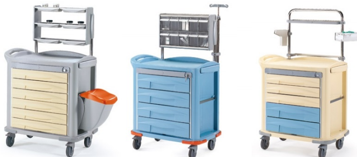
Zamieszczone zdjęcia mają charakter poglądowy.